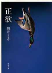
朝井リョウ 著 新潮文庫

幸せのかたちはそれぞれ。認め合い。常識や価値観は昔とは違う。多様性が謳われる時代で、あなたはすべてを受け入れることはできますか？そもそも無意識のうちに受け入れる側に立っていませんか。