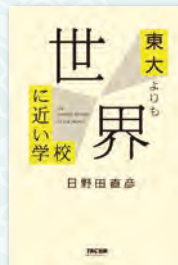
日野田直彦 著 TAC出版