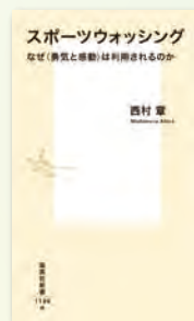
西村 章 著 集英社