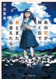
汐見夏衛 著 スターズ出版

親や学校、すべてにイライラした毎日を送る少女がある日、母親と喧嘩をして家を飛び出し、目をさますとそこは70年前、戦時中の日本でした。偶然通りかかった特攻隊員の青年に助けられ、彼と過ごす日々の中、少女は青年の優しさと誠実さに惹かれていきますが自分の想いに気づき想いを伝えようとした時、青年に出撃命令が下されてしまいました。