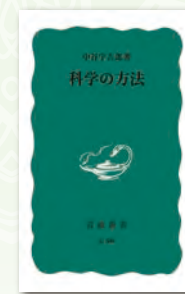
中谷 宇吉郎 著 岩波書店