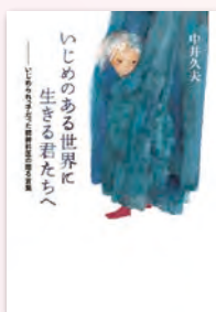
中井 久夫 著 中央公論新社