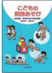
◎こどもの運動あそび (橋本妙子、啓明出版、2007年)

本書は、子どもの発達を促す運動遊びをイラストでわかりやすく解説したものです。基本的な運動、用具を使った運動、運動会での遊戯創作法や組立て体操を、単純な動きのものから次第に複雑で意欲的に挑戦していけるものへと展開させて紹介しました。幼稚園、保育所での毎日の活動は、子ども達の発育発達を保障する重要な役割を担っています。体を思い切り使って遊ぶ楽しさ、爽快感を是非子ども達に伝えて欲しいと思います。