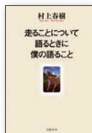
◎走ることについて語るときに僕の語ること(村上春樹、文藝春秋、2007年)

走りつづけて四半世紀という著者が、走ることの第一目的は「小説をしっかり書くために身体能力を整え、向上させる」ことにあると言いつつ、走ることを軸にして、私生活を丁寧に語っている。「Pain is inevitable. Suffering is optional.」というフレーズがマラソンという競技のいちばん大事な部分を簡潔に要約しているとして紹介している。